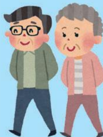
ていねん ろうご 定年・老後