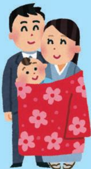
けっこん しゅっさん 結婚・出産